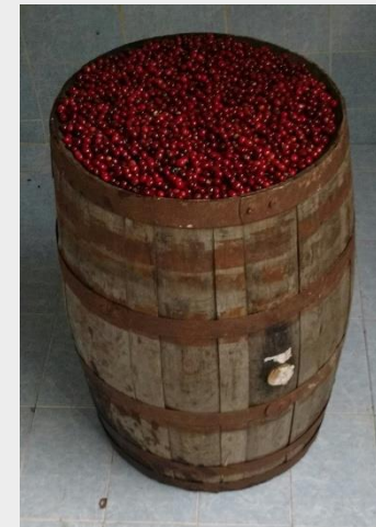
Innovación y adecuación del rumbo