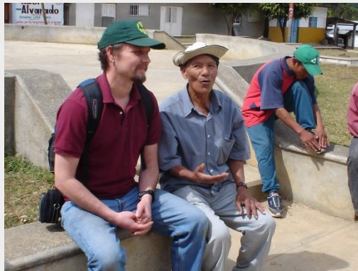
Aliados mas compatibles