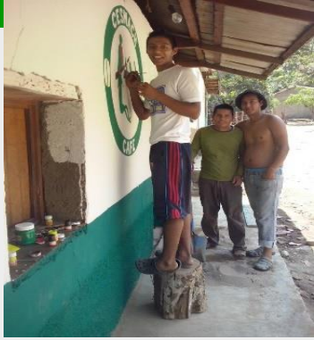
Visión y objetivos De largo plazo