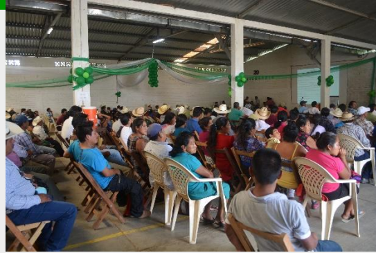
Información, transparencia, rendición de cuentas, acuerdos