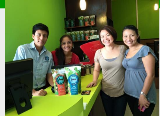
Integración y formación de capacidades