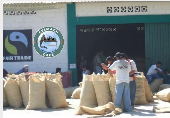
Integración horizontal y vertical