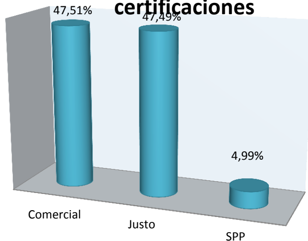
Ventas por tipo de mercado/ certificaciones